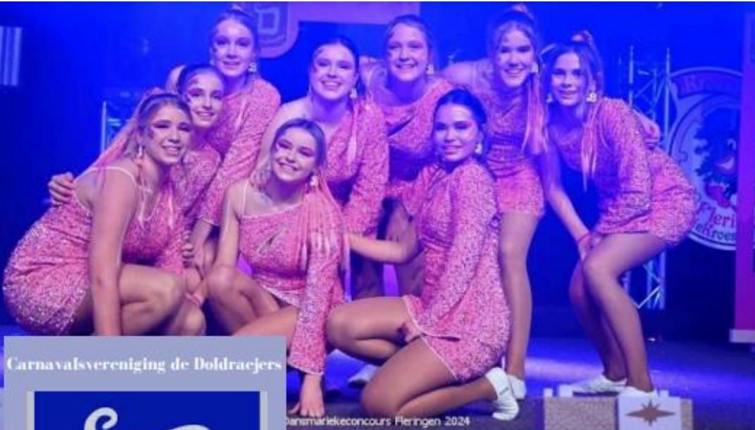
Carnavalsvereniging de Doldraebers